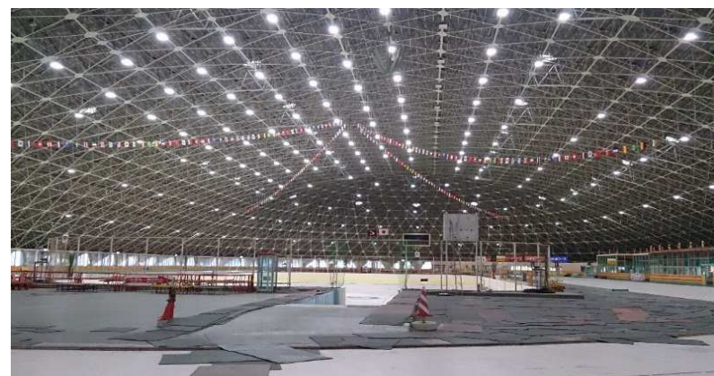
秋田県立スケート場LED改修