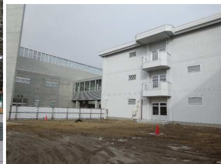
秋田県立秋田工業高等学校改築

(お問い合わせ先) TEL 0186-57-8203 FAX 0186-57-8204