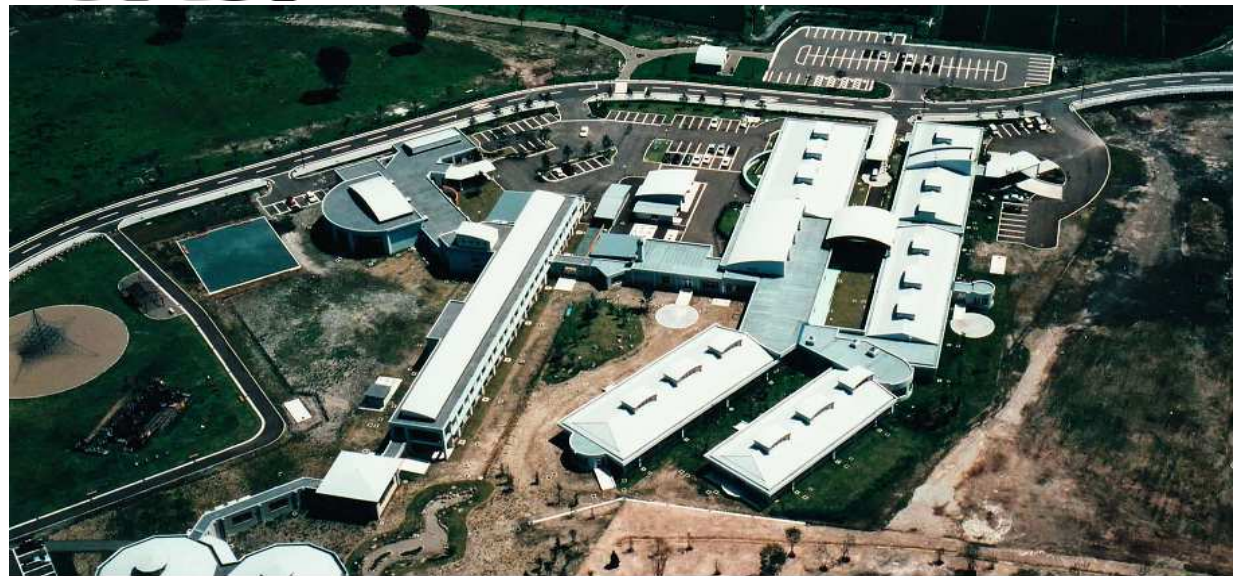
北部老人福祉エリア整備事業